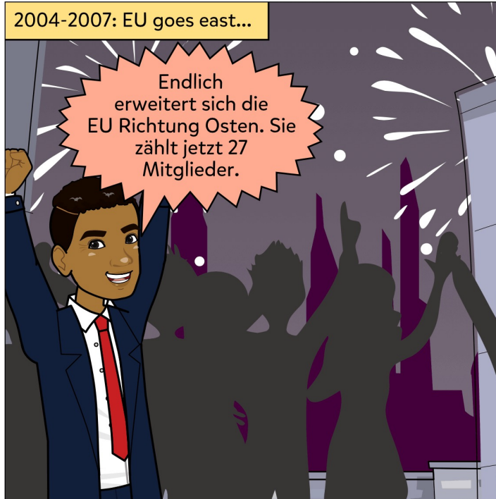
Erneuerung des Schengener Abkommens 2007

Endlich erweitert sich die EU Richtung Osten. Sie zählt jetzt 27 Mitglieder.