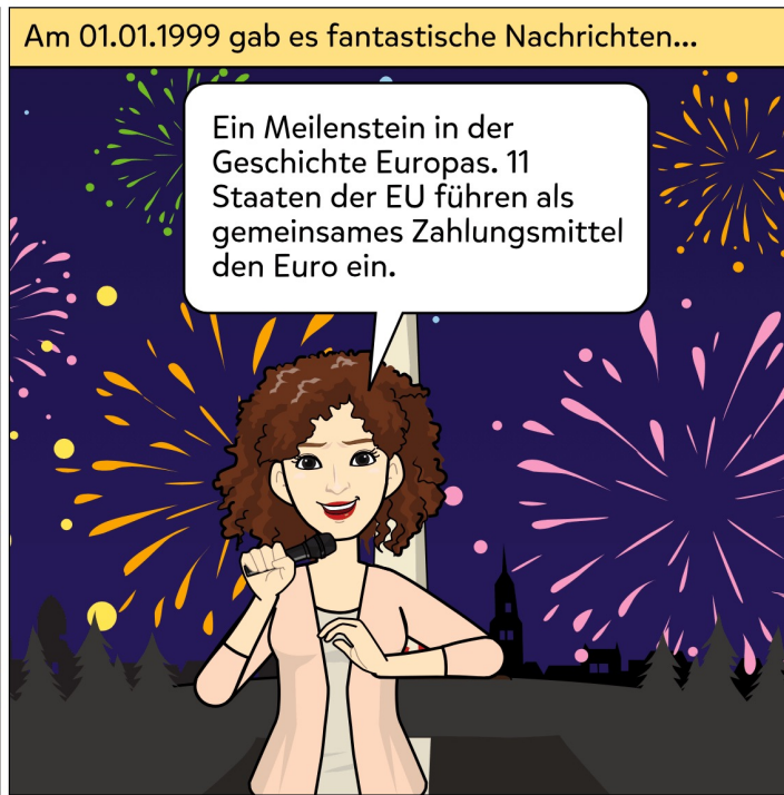
Am 01.01.1999 gab es fantastische Nachrichten...

Ein Meilenstein in der Geschichte Europas. 11 Staaten der EU führen als gemeinsames Zahlungsmittel den Euro ein.